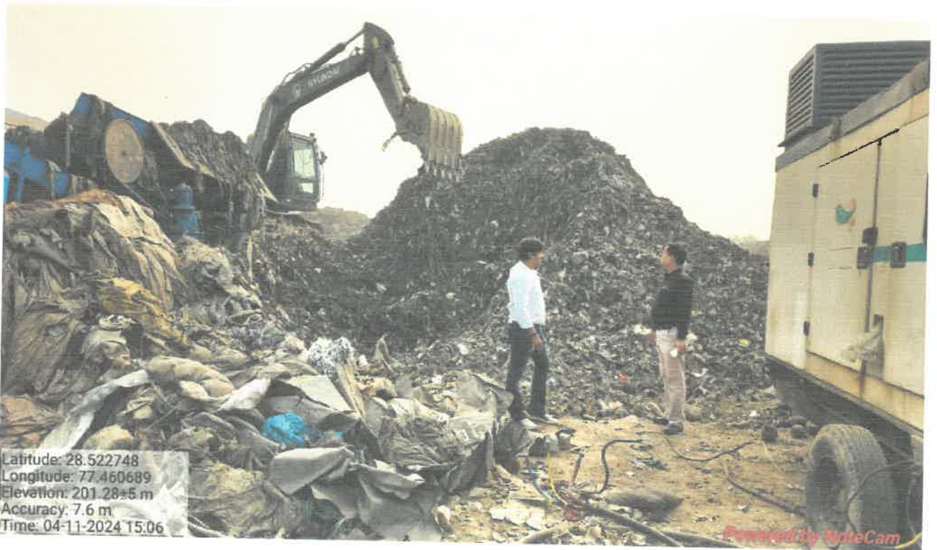
Legacy waste lifting